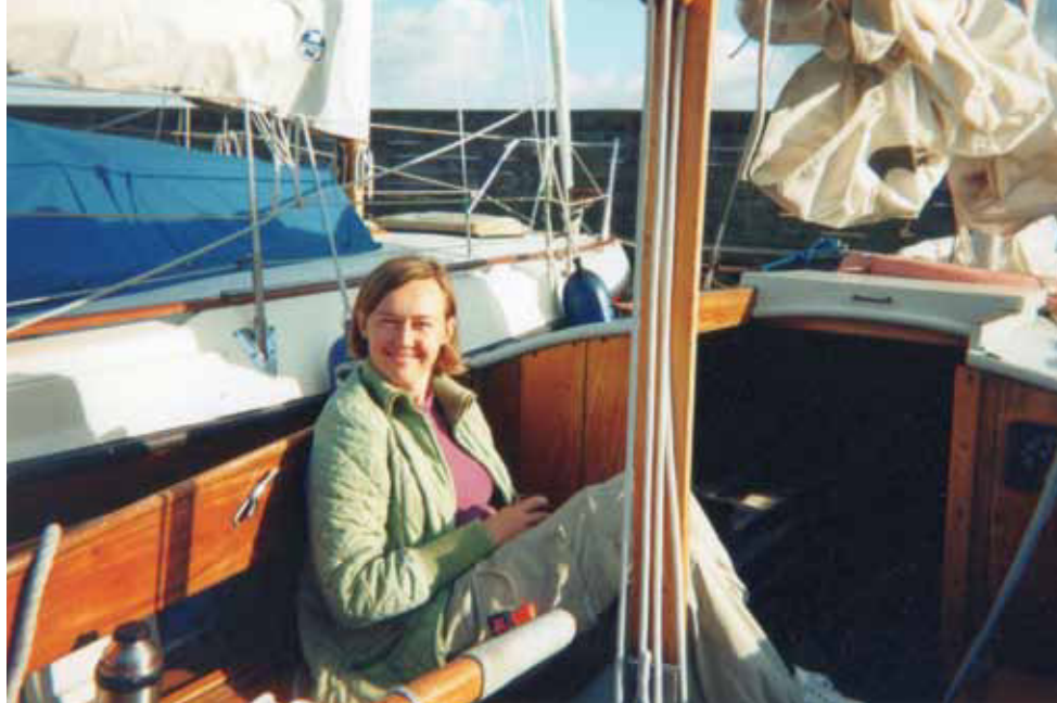
Nyerhvervelsen "Amanda" i Vedbæk Havn

Der hersker altid fest og kreativitet, når fællesskabet er ombord – se blot her et spiseligt bjærgemærs med "Amanda"s navn på