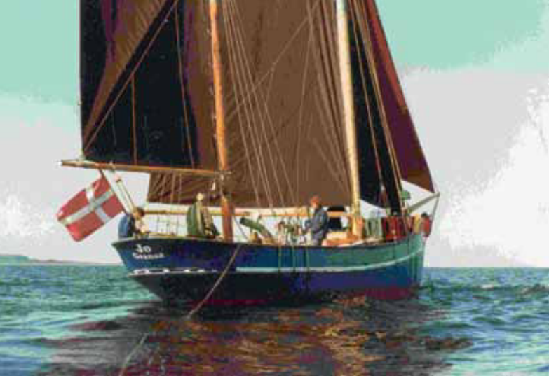
Evas tidlige bekendtskab med fartøjer af træ – nemlig hajkutteren "Jo" – som her ses på Kattegat – med harpunloggen på slæb