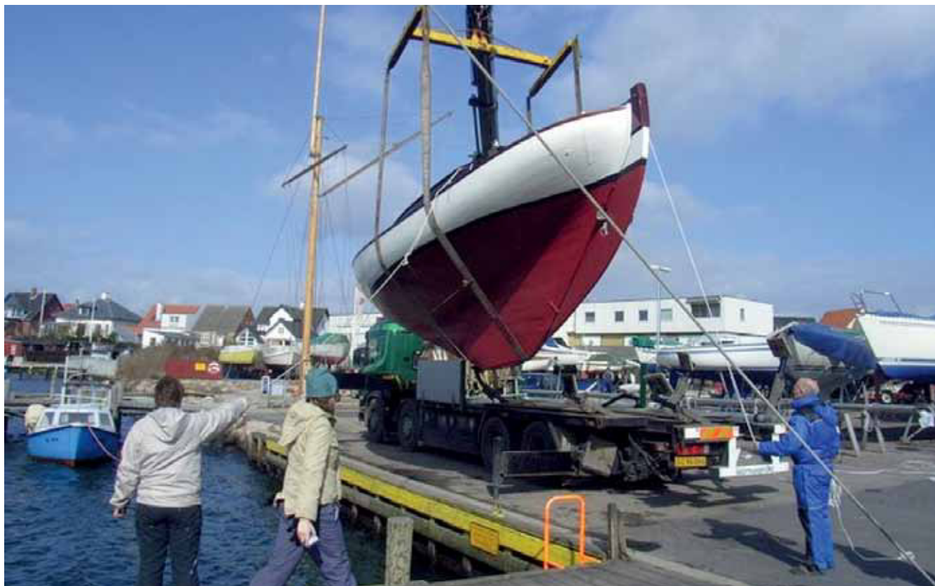
Endelig blev "Passat" søsat i Fåborg Havn i 2008 og kunne derfor deltage i DFÆL-træffet i Assens i starten af juli

Læs Evas fornøjelige beretning om det store bådskippe og de første måneder med "Passat" i DFÆL-bladet nr. 97 – find den på DFÆLs hjemmeside under "Bladet"