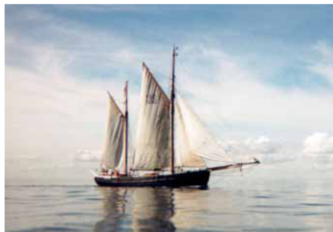
Galeasen "Skibladner" blev Evas tilbagekomst til træbåds miljøet. Båden var ejet af FDF, og Eva sejlede med gennem et par sæsoner, før hun kastede sig ud i bestræbelserne for at få foden under eget ruf