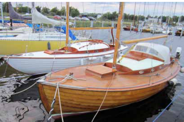
En flot længedragssjulle eller koster ligger ved siden af en fin folkebåd

lille Grötvik Havn nær Tylö Fyr ved Laholmbugtens nord-pynt, så jeg fortsatte ind til den store Halmstad Havn og anløb den lille lystbådehavn yderst. Og pludselig befandt jeg mig i et lille træbådsmecca med rigtigt mange fine både og – viste det sig – ovenikøbet med spændende træbådsaktiviteter.