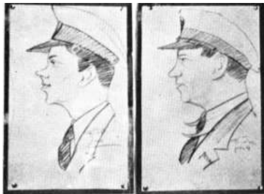
Vi var i Tivoli.

hjem og passe vor daglige Dont. En Grog gør vel nok godt i Aften, det er blevet langt ud paa Natten.