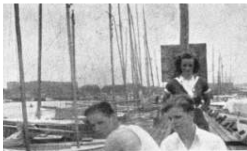
Der ventes paa Luft i Sundby