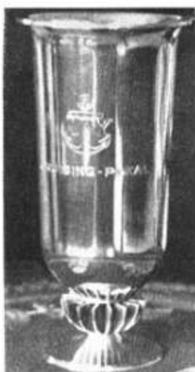
Pokal, som „Kanok“ vandt for 1939.