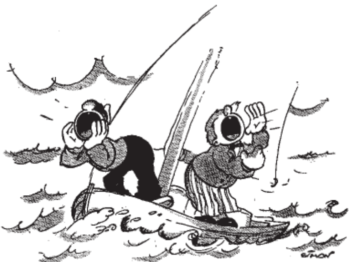
— atter og atter lyder Kommandoraabene: „Klar, vende, læ“ - „fast“.

Efter et spændende Kryds gennem de snævre Farvande fra Broen forbi Farø, Lilleø og Tærø naar vi Kallehave Kl. 13,30; men kun for at faa en „Skude“ varm Mad, thi det er nu blæst saadan op, at der ikke kan laves varm Mad, medens vi sejler. Kl. 14,30 er derfor de stærkt mindskede Sejl sat, og med strygende Fart gaar det mod Bøgestrømmen. „Der er en Styrbordskost — der er en Bagbords,“ lyder Observationerne hele Tiden, og stakkels os, hvis vi ikke holder Kostene paa de rigtige Sider, thi at gaa paa Grund med den Fart, vi sejler med, vil sikkert nok faa Følger. Atter og atter lyder Kommandoraabene: „Klar vende — læ,“ og Svaret „fast“, „Klar vende — læ“ „fast“ om igen og om igen. Afmærkningen er storartet, det er saa let at finde Vej, at vi næsten ikke behøver at raadspørge Kortet. Da vi havde krydset Bøgestrømmen ud, satte vi Kursen mod Nord. Østersøen viser sig snart i sin Vælde, da det kuler yderligere op. Sværere Sø end den vi har her, kan vi roligt sige, at vi al-